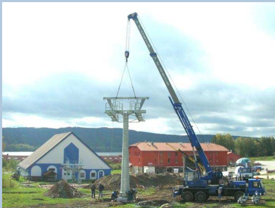
Zvedání prvního sloupu nové lanovky

Tento projekt Skiareál Lipno – regionální zimní centrum je spolufinancován Evropskou unií