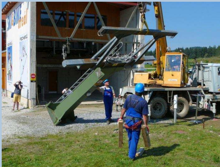
Demontáž původní lanovky

Tento projekt Skiareál Lipno – regionální zimní centrum je spolufinancován Evropskou unií