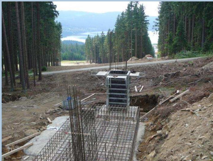
Betonování nové výstupní stanice

Tento projekt Skiareál Lipno – regionální zimní centrum je spolufinancován Evropskou unií