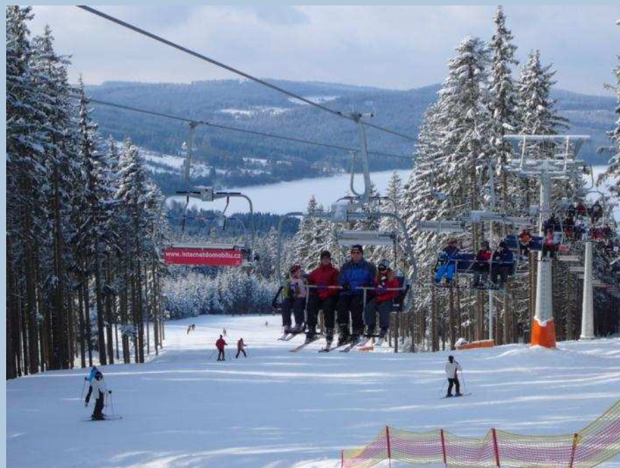
Pohled na novou lanovku a novou část Jezerní sjezdovky

Tento projekt Skiareál Lipno – regionální zimní centrum je spolufinancován Evropskou unií